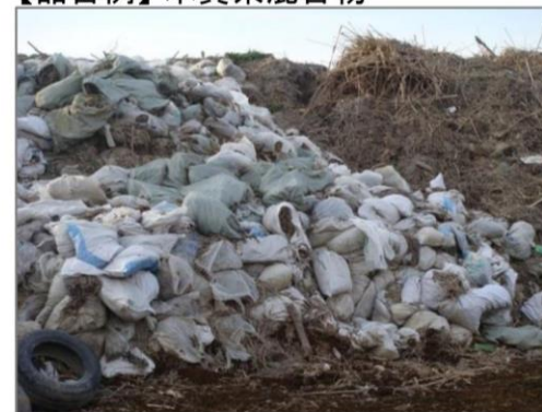
【品目例】木質系混合物