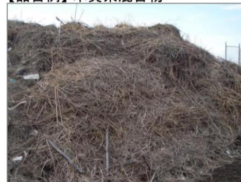
【品目例】木質系混合物