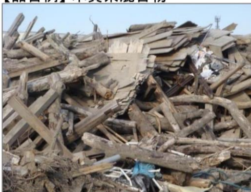
【品目例】木質系混合物