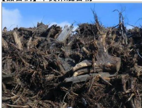
【品目例】木質系混合物