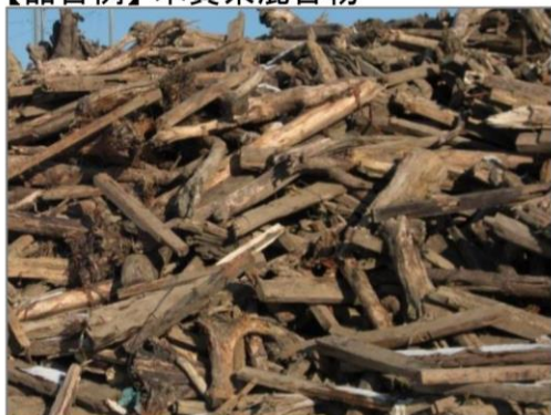
【品目例】木質系混合物