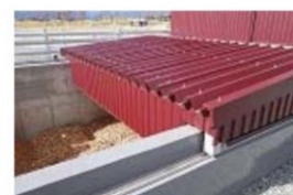
地下式 —チップサイロ—